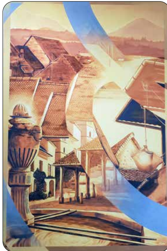
Une nouvelle fresque et devise ont été peintes dans la salle du conseil en janvier par l'équipe de Projet Mural Studio. Un grand merci à eux pour cette belle œuvre !

Je veux également remercier les nombreux habitants et habitantes qui apportent leurs idées et leurs bras dans les commissions municipales. C'est aussi la meilleure manière de renouveler et d'enrichir les équipes pour le prochain mandat, en s'appropriant les débats, en s'initiant aux rouages administratifs et, espérons-le, en suscitant des vocations pour les projets collectifs présents et à venir.