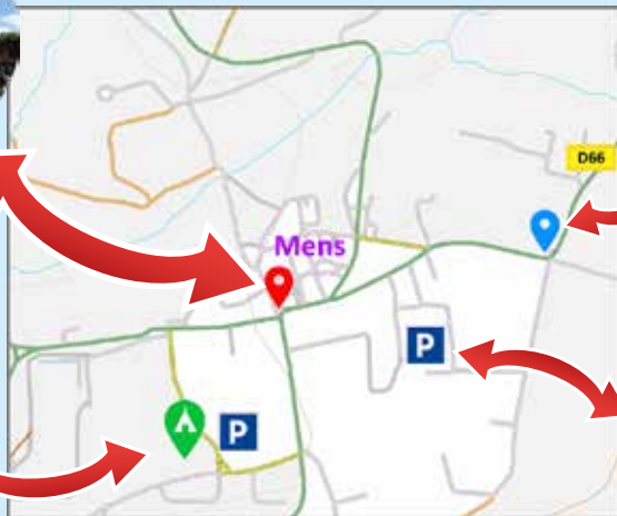
Le carrefour de la Croix