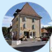
L'auberge de Mens