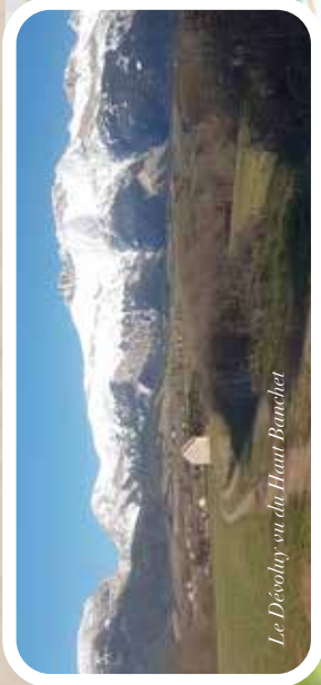
Le Dévoluy en du Haut Banchet